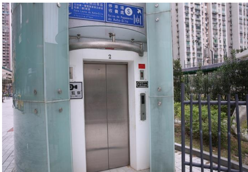
圖片三：停車場升降機