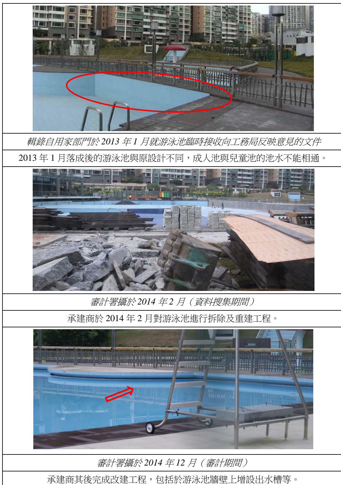
圖片二：中央公園游泳池

因此，需拆除已建成的部分，然後再於上述部分的泳池牆壁上增設出水槽，以及相應的排水設施和出水口，有關後加工程涉及金額為 1,013,296.00 澳門元 9 。