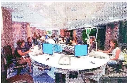
教育資源中心提供舒適的工作空間

年發揮藝術創意、各展所長的交流平台；教育資源中心是為教師提供舒適、休閒的教具制作、資料搜集和休息的空間；而駿菁活動中心新大樓是為該區青少年提供一個嶄新的健康、安全、多元化的運動場地，由此可見各中心均需不同的設備配套去配合服務理念，所以每個中心進行工程所採用的材料不盡相同。