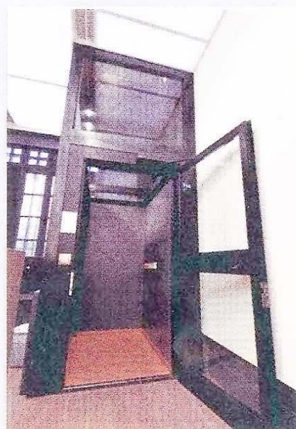
青少年展藝館無機房升降電梯

本局各項設施的優化工程，均積極以無障礙設計貫徹傷健共融的理念，關顧不同群體的需要，用心為民服務，務求使每一位學生、青少年和市民都可利用各中心的設施進行學習和休閒活動。例如：青少年展藝館是鄰近地區唯一一個專門為青少年展示藝術創意和才華的場所，該建築被列為受保護的、屬具建築藝術價值的建築物，為免破壞建築結構和達至無障礙設計的概念，特別選用無機房的垂直油壓式升降電梯，並在牆身加裝特別結構裝置以支撐電梯的重量和運作需要；德育中心位處建築物3樓，現場環境無法安裝垂直升降電梯，為了方便輪椅使用者出入，特別裝置了依附樓梯運行的自動輪椅升降台。現時本局轄下的多個中心在條件許可的情況下，進一步提供夜間(非辦公時間)無障礙洗手間設施，以便有需要的人士使用。