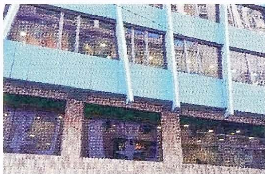
氧化銅片外牆藉自行氧化節省維護費

本局認同並遵守節約原則，同時， 合理適當的運用原則同樣重要 ，而節約原則，亦非單純以購買設備時價格的高低來判斷，還應全面考慮設施的整個使用壽命期，以及對人體健康的影響和環境配合等因素。有研究分析指出： 設施的購買費用一般只佔設施使用壽命總價