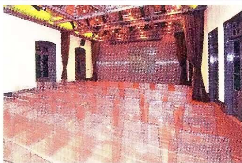
透明座椅配合裝飾藝術風格