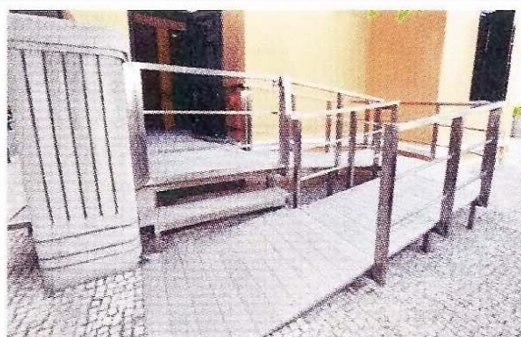
無障礙洗手間在非辦公時間繼續開放