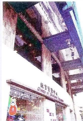
鏡鋼可採納自然光

值（包括購買費用和維護費用）的 25%。可見物品日後的維修費用比其價格更應作為購買時的考慮因素，例如：教育資源中心外牆裝置的氧化銅片，正是為免除日後維修保養費用的支出所採用的設計；使用鏡鋼的原因是因為一樓較外牆凹入，為貫徹環保設計的理念，加裝此設施可達到盡量採納更多自然光的功效。而事實表明，由 2005 年 9 月該中心開幕至今氧化銅片、鏡鋼的組合、以至中心其他大型設施都未曾進行過維修，從而節省了大量維護費用。