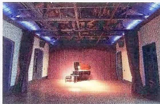
青少年展藝館洋溢文化氣息

如審計報告所述，正因為本局的教育及青年服務設施的設置，對市民、尤其是學生及青少年的影響較為廣泛，是為不同年齡、不同階層人士提供舉辦教育及康體活動的場所，因此每一設施的設計風格均反映不同服務對象的需要，而顯現出百花齊放的設計風格，例如：青少年展藝館是培養青少年的創意思維和自信心，讓青少