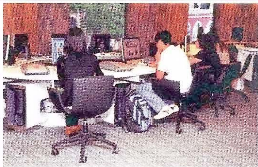
精選設施為教師提供優良環境

在選用傢具方面，既要考慮到其實際功能，也要考慮到與現場環境的配合。例如教育資源中心在選用電腦座椅方面，除考慮到空間的充分利用、整體設計的配合以激發教師創新思維外，更重要的是讓教師們長時間使用電腦進行教材、教具的準備工作時可減少疲累，同時保護脊椎的健康；青少年展藝館內供市民觀看表演用的透明膠椅子，除了椅子的功能外，亦是作為一種與建築物所顯現的裝飾藝術(Art Deco)風格相配合的展品，以營造出一種濃厚的藝術氛圍。