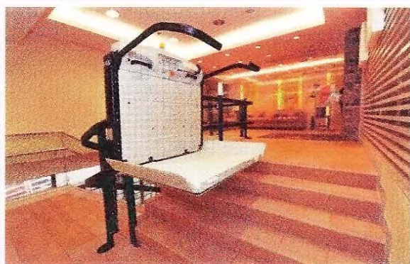
德育中心的自動輪椅升降台