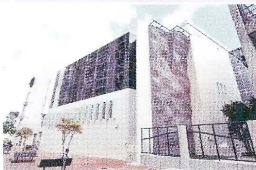
駿菁活動中心新大樓

同時，各中心本身的基本條件不同，於設計時需要按設施環境、功能採用不同的方法，例如青少年展藝館是受保護的、屬具建築藝術價值的建築物，在設計時需充分考慮如何配合，而工程進行期間必須先進行特別的保固工作；青年試館是在已有基本設備的地方進行改裝，只需小量修改即可使用；駿菁新大樓是新建一幢樓高 3 層的體育運動為主的大樓等等。可見本局轄下設施的功能和環境均各具特色，建造上述設施經過本局專業人員長期的分析、收集和研究才能作出，因此，本局是根據各中心的具體情況， 實事求是地計劃裝修工程的成本預算。