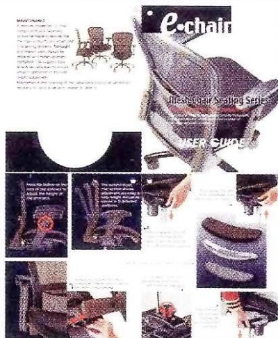
座椅經科學設計保障健康

定品牌。以直接判給方式增補枱椅，除可減省再次展開書面諮詢的行政程序外，主要是體現對待員工一視同仁，以及從辦公室的整體佈置考量，避免同一辦公地點出現五花八門的辦公枱椅。這些增補採購的枱椅，約佔總採購量的三分之一。