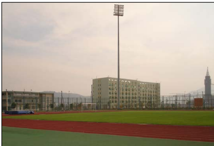
图一：澳门科技大学足球场