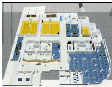
图一：活动中心一楼设施示意图，占地 53,285 平方呎

2.1.3.5 活动中心的布置区域分 3 层，一楼（CV3）至三楼（CV1），见图一至图三。