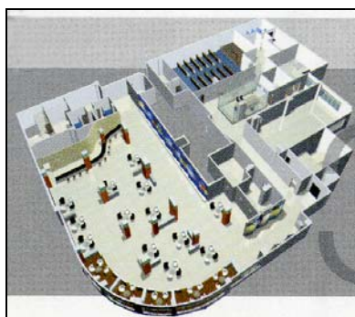
图三：活动中心三楼设施示意图，占地 20,905 平方呎