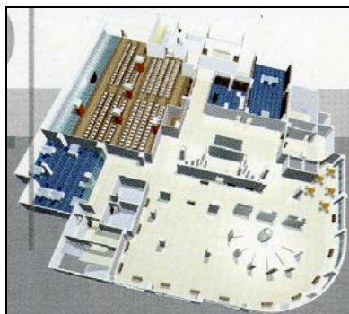
图二：活动中心二楼设施示意图，占地 30,423 平方呎

休闲阅读室、互联网室、舞蹈室、乒乓球室、桌球室、乐队练习室、音乐练习室、模型摆设室等